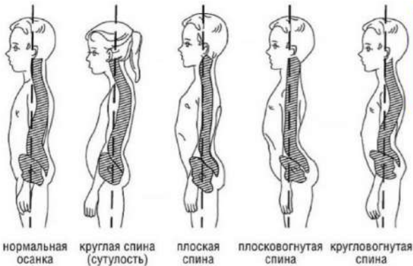
нормальная осанка круглая спина (сутулость) плоская спина плосковогнутая спина кругловогнутая спина

Осанка - это привычное положение тела человека в пространстве, которое он принимает без лишнего напряжения мышц, то есть при правильной осанке позвоночник испытывает минимальную нагрузку.